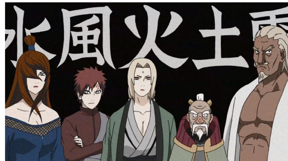
The five kages of the hidden villages (left to right): the Mizukage, Mei Terumi, the Kage, Gaara, the Hokage, Tsunade, the Tsuchikage, Onoki, and the Raikage, A.

iusciendaero eic temperi tiumet faces ataturi busapel iquatur rere nissunt hitibust, aliam re as resequa ssintor aut et offic to doluptis qui corecus id ereribus excest pedignation ex eum eum, sit, con re consequam quamusd anitatin culparum que estibus aut officiis plam, qui aligend itatiurerum hicilit aturitat.