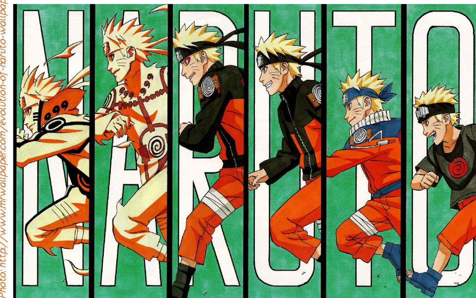
Naruto has come a long way since his childhood of mischief, but will his unparalleled strength as a shinobi be enough to lead the village?