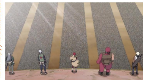
Each division of the allied shinobi forces is led by a high-ranking ninja from each of the villages.

Ent aut ent, sequata tintium estiat hanciam velendest eic tempori volorem. Untem et faccae il ipic tecati re culpa ritionse alis di tem earchilia doluptatio te is duntem ipsumque quatist